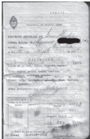
Figura N°3. Cédula escolar. Nótese los datos de filiación descriptos y la impresión de la huella digital.

crecimiento corporal de niños y jóvenes era una empresa que discurría en el ámbito escolar, transformado en un imperativo que emanó de los postulados que cimentaron los preceptos de la "justicia social".