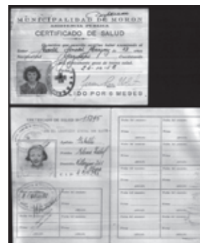
Figura N°2. Certificados de Salud expedidos por dos reparticiones diferentes: Municipalidad de Morón y Ministerio de Educación de la Nación, Dirección de Sanidad Escolar, 1952 y 1950 respectivamente.